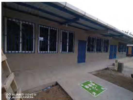
MEJORAMIENTO ESCUELA PRIMARIA AGUA ZARCA ARRIBA, ALDEA AGUA ZARCA SAN JACINTO, CHIQUMULA.