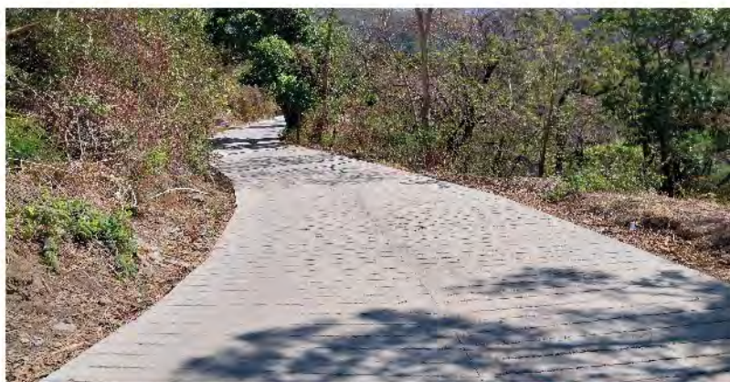
MEJORAMIENTO CAMINO RURAL LOS GONZALES, ALDEA AGUA ZARCA SAN JACINTO, CHIQUIMULA.