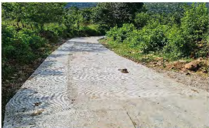
MEJORAMIENTO DE CAMINO RURAL ALDEA EL ZAPOTE, SAN JACINTO, CHIQUIMULA.