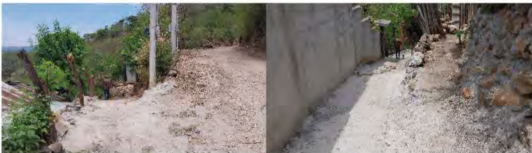
MEJORAMIENTO DE CARRETERA RURAL, CASERIO LOS PEREZ, ALDEA LOMAS, SAN JACINTO, CHIQUIMULA (MURO CONTENCIÓN).