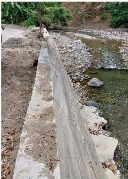
MURO DE PROTECCIÓN SECTOR LAS GOLONDRINAS, BARRIO EL TAMARINDO, SAN JACINTO, CHIQUIMULA