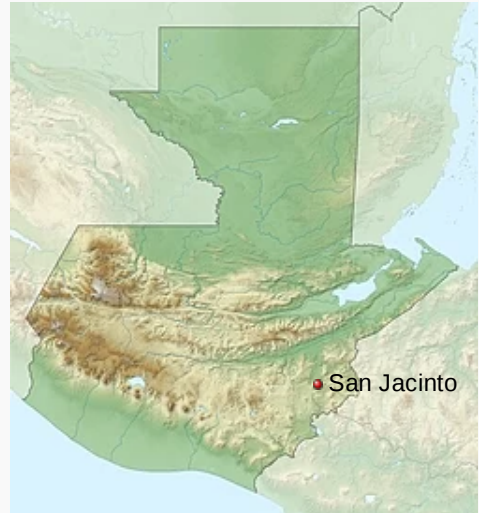
Localización de San Jacinto en Guatemala