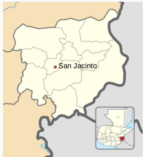
Localización de San Jacinto en Chiquimula